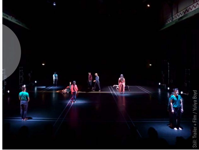
Still: Trailer + Film / Yuliya Boyd